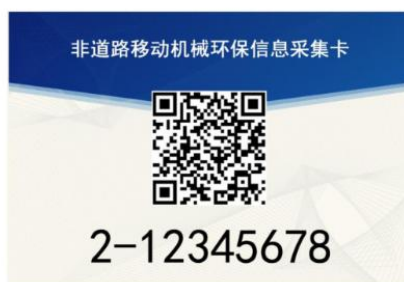
图 2 采集卡正面样式